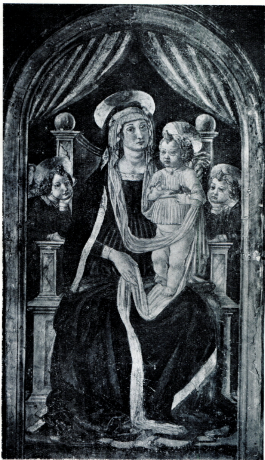
Fig. 11 — COSIMO ROSSELLI - La Madonna in trono e due angeli. (Firenze, Tabernacolo delle Cinque Lampade)