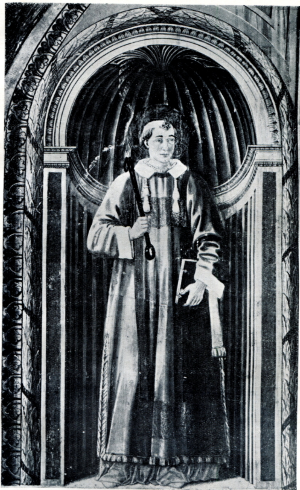
Fig. 5 — COSIMO ROSSELLI - S. Leonardo . (Fiesole Duomo)