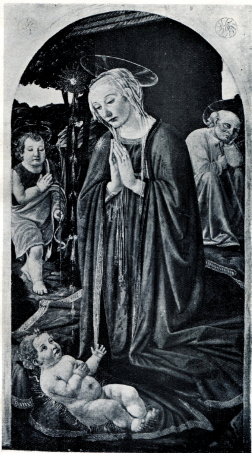
Fig. 8 — COSIMO ROSSELLI - Adorazione del Bambino . (Breslavia, Schlesisches Museum)