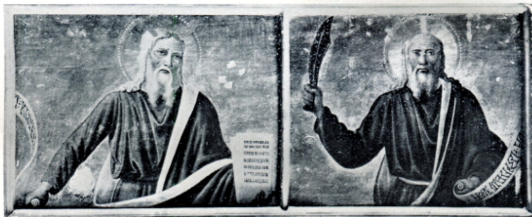
Fig. 3 — COSIMO ROSSELLI - Mosè e Abramo . (Firenze, Galleria dell'Accademia)

David e Noè (N. 8632) (fig. 4) sono probabilmente frammenti di una stessa predella e, come parti di secondaria importanza di un'opera maggiore, potrebbero rivelare anch'esse la mano di un aiuto. Tuttavia sia Adolfo Venturi 16 che Bernardo Berenson le hanno assegnate senz'altro al maestro, non precisandone però il momento stilistico. Non pertanto è innegabile la strettissima parentela di tali figure con quelle virili della « Pietà » di Berlino. Vediamo la stessa trattazione dei volumi a masse ampie ma senza sodezza plastica, lo stesso studio coloristico ingenuo e monotono. Gli occhi piccoli sono tagliati nella medesima forma e le ciocche dei capelli sono segnate con eguale, compiaciuta minuzia. Tra il « Nicodemo »