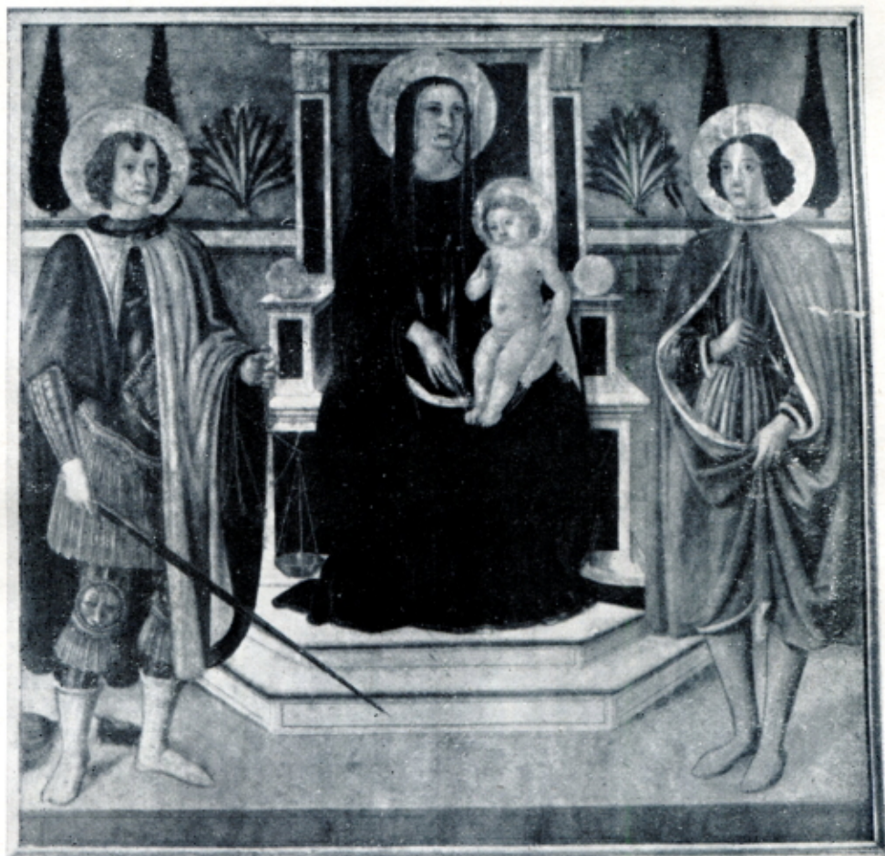
Fig. 6 — COSIMO ROSSELLI - Madonna in trono e due Santi. (Londra, Coll. Mrs. Henry Maclaren)

Non senza fondamento la studiosa che per prima pubblicò questa tavola 22 l'attribuiva alla scuola di Domenico. Ma la paternità di Cosimo è sicura, chè la Vergine risente di un tipo che sarà solito al nostro, mentre i Santi Francesco e Antonio Abate, senza