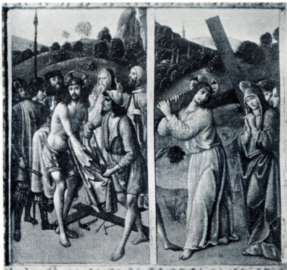
Fig. 1 — COSIMO ROSSELLI - Cristo spogliato e la salita al Calvario. (Londra, Coll. Harris)

rosкуро, come si nota nel Santo imberbe (in primo piano, a destra), che subisce per altro una chiara suggestione verrocchiesca. Ma l'illuminazione fiacca ed incerta non vale certo ad esaltare, bensì piuttosto a limitare il già debole afflato poetico che anima il quadro.