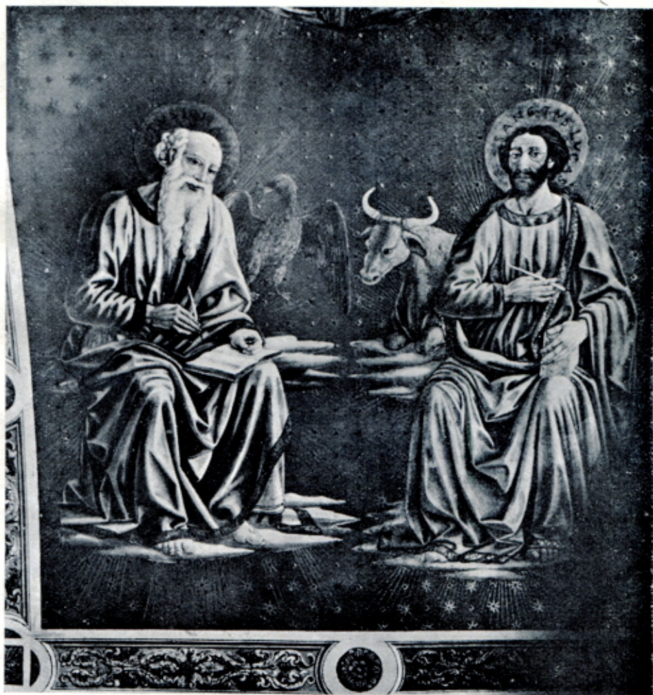
Fig. 4 — COSIMO ROSSELLI - Due evangelisti, affreschi nella volta della C. Salutati. (Fiesole, Duomo)

caratteri che potrebbero togliere questo dipinto, di schema troppo semplice e schietto, ai seguaci dell'Angelico per attribuirlo al Rosselli giovane sembrano piuttosto dovuti ai numerosi guasti dovuti al tempo e alle ridipinture.