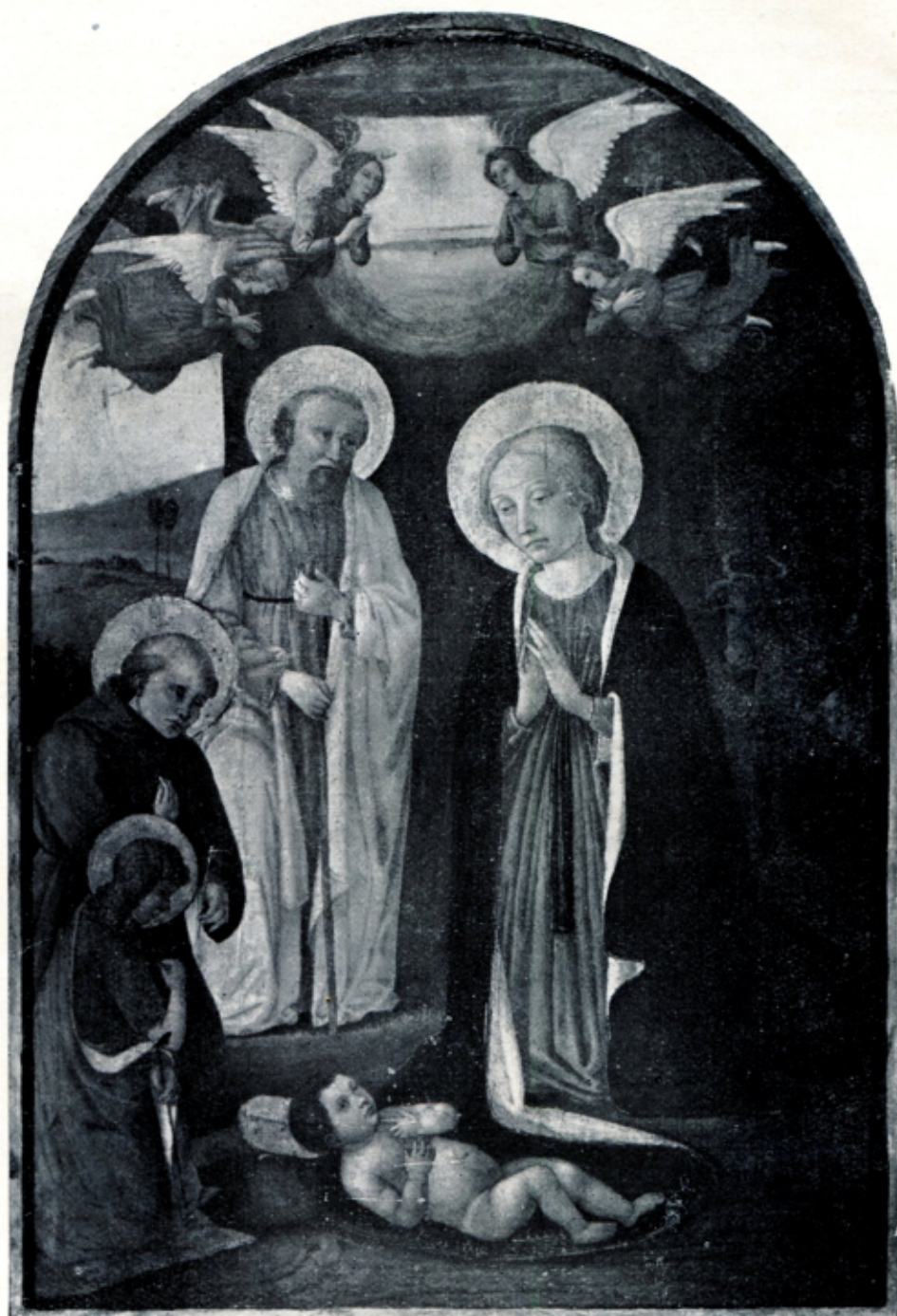
Fig. 9 — COSIMO ROSSELLI - Adorazione del Bambino e i SS. Giuseppe e Francesco. (Roma, Proprietà privata)

Chiusa la parentesi di questa produzione di secondaria importanza e inquinata da larghi tratti d'esecuzione di bottega, la «Madonna col Bambino» della Walters Gallery di Baltimora