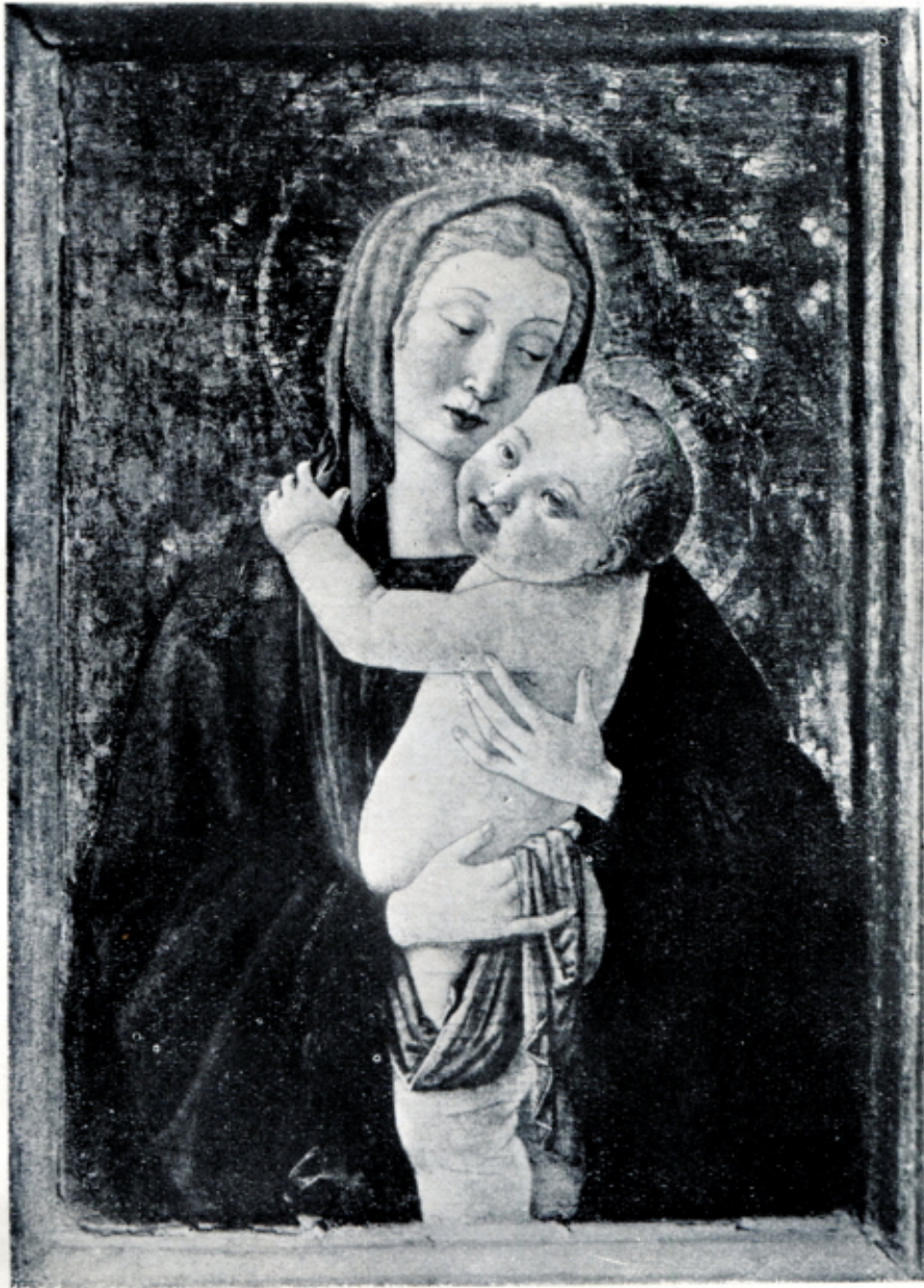
Fig. 10 — COSIMO ROSSELLI - Madonna con il Bambino . (Baltimora, Walters Gallery)

(fig. 10) ci riconduce senz'altro al maestro. Non deve essere trascorso gran tempo dall'esecuzione della Adorazione Hertz se