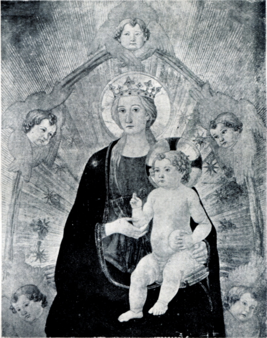
Fig. 7 — COSIMO ROSSELLI - Madonna con il Bambino . (S. Marino California, Huntington Museum)

si è altresì raffinato in una certa squisitezza del disegno che s'indugia con compiacimento a intessere il broccato di una veste o di una tenda, o a cesellare la rifinitura di una cornice di marmo.